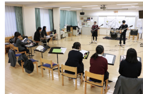
▲バンドクリニック