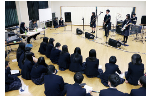
▲アンサンブルのレッスン