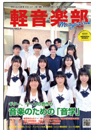
●軽音楽部マガジン