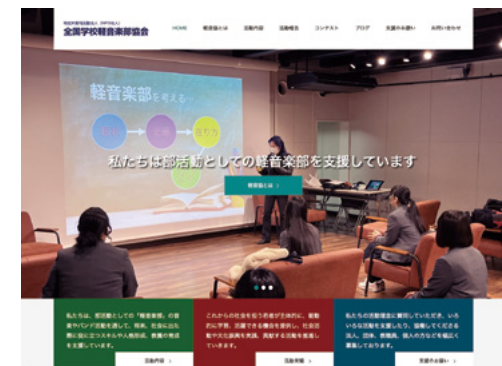
●ウェブサイト／ブログ